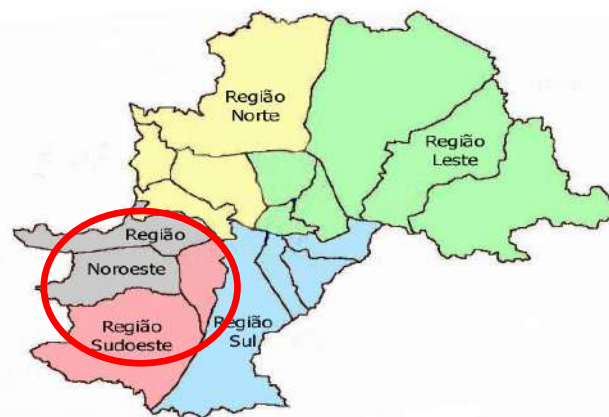
Município de Campinas Distritos Saúde

Em razão de sua finalidade de Hospital Universitário, os serviços prestados pelo HMCP qualificam-se como serviço público não estatal, em vista do volume assistencial, da qualidade e da diversificação das ações disponibilizadas à população, notadamente aos usuários SUS-dependentes.