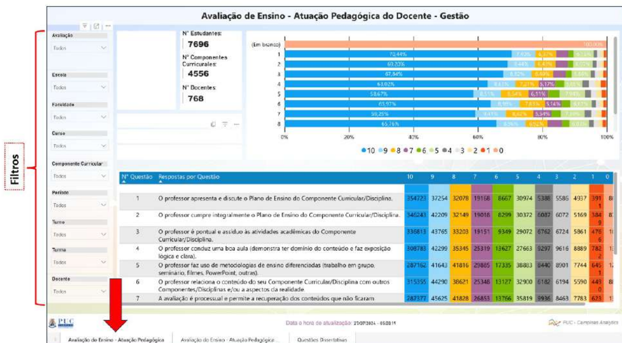
Figura 1. Exemplo Tela do BI com filtros disponíveis – Visão do Gestor – Atuação Pedagógica do Docente.

De modo a estimular a reflexão e a organização das ações, a CPA, junto à Pró-Reitoria de Graduação, desenvolveu ações de conscientização e capacitação nas Escolas, envolvendo as ferramentas de análise de resultados disponíveis em BI, tanto para os gestores, quanto para os docentes. Por meio de filtros, é possível verificar os resultados sob óticas diversas e entender o contexto e as percepções dos estudantes.