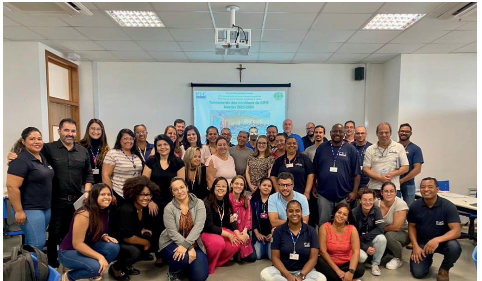
Gestão 2024 da Comissão Interna de Prevenção de Acidentes - CIPA