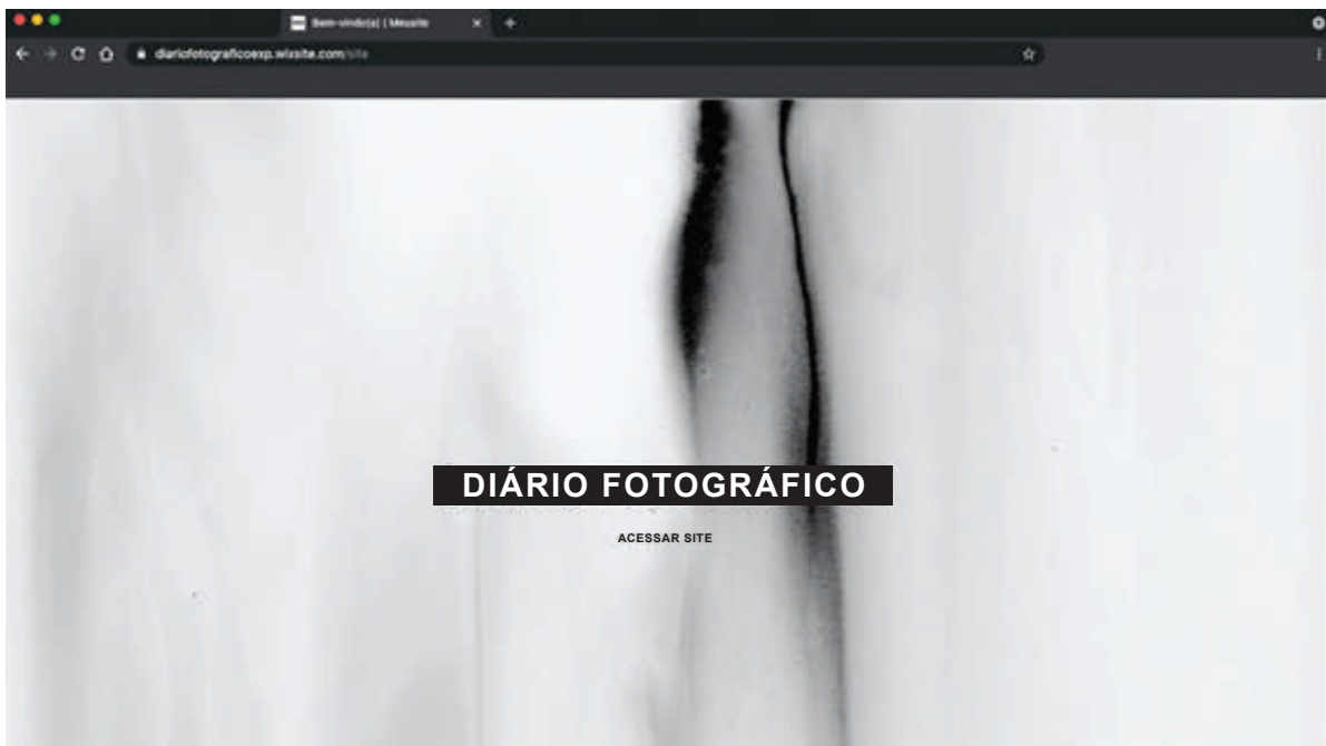
Figura 1. Página de abertura do projeto Diário Fotográfico, realizado na disciplina de Fotografia A, 1º semestre de 2020.

A forma de organizar e apresentar a produção realizada convergiu também para o que chamamos de produção em processo. Considerando o ambiente da internet para isso, resolvemos desenvolver uma espécie de site-laboratório no qual os estudantes pudessem disponibilizar seus trabalhos fotográficos (Figura 1). Esse foi um fator importante, pois, a partir dessa proposta, eles perceberam que o próprio formato de galeria-portfolio no site estava indicando, por meio do design escolhido, que os puzzles de apresentação das imagens ajudavam a perceber as conexões formais entre elas. Assim, nesse ambiente, os estudantes tinham acesso ao seu espaço pessoal no site para construir a galeria-portfolio no formato que mais lhes interessasse.