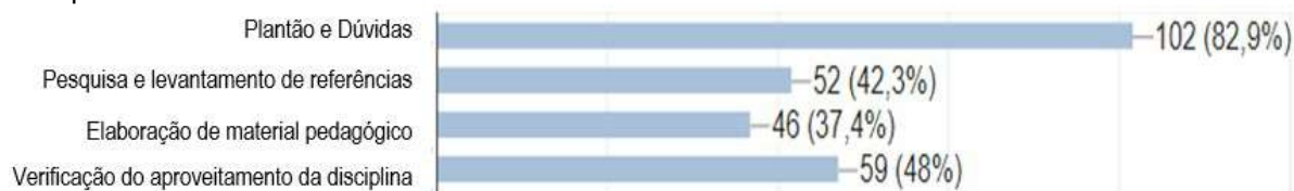
Gráfico 1: Apresentação das demandas de atividades para o monitor durante o 2º semestre – PUC-Campinas. 2020.

Os ajustes e o formato foram considerados adequados por grande parte dos professores, enquanto algumas observações foram levantadas, como: maior quantidade de bolsas, melhores valores de bolsas, melhor aproveitamento dos monitores, melhoria do processo de captação de alunos (sistema), a continuidade on-line (parcial) mesmo com retorno presencial.