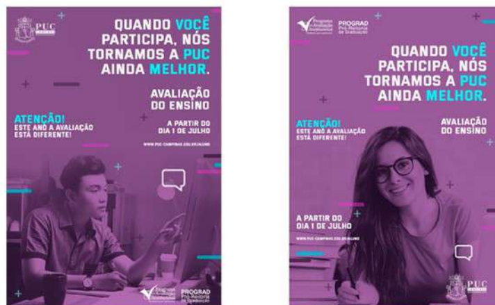
Figura 2: Cartazes da Campanha da Avaliação do Ensino para o 1º semestre de 2020.

O GT, como em 2019, organizou a banca de escolha da campanha da AE de 2020 (figuras 2 e 3).