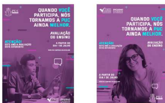
Figura 2: Cartazes da Campanha da Avaliação do Ensino para o 1º semestre de 2020.

O GT, como em anos anteriores, organizou a banca de escolha da campanha da AE de 2020 que foi realizada pela produção acadêmica dos estudantes do curso de Publicidade e Propaganda (figuras 2 e 3).