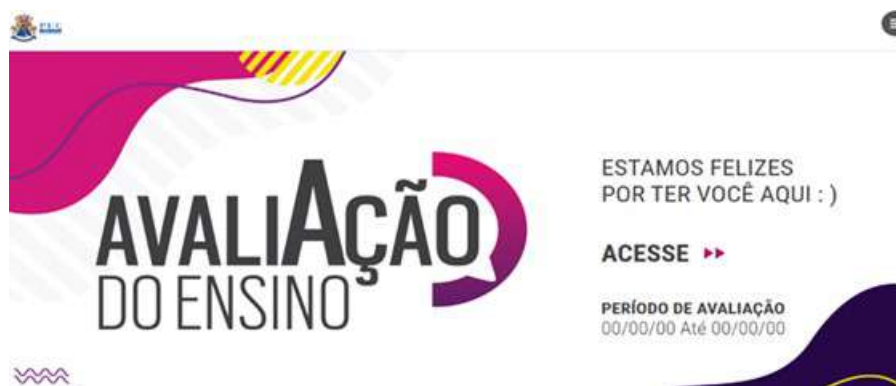
Figura 1: Novo design do Instrumento da Avaliação do Ensino.

Além das dimensões já existentes no Instrumento, e atendendo à solicitação da PROGRAD/COGRAD, o GT desenvolveu uma dimensão para avaliar as atividades do ensino remoto utilizado durante a pandemia. As questões sugeridas pelo GT e aprovadas pela PROGRAD estão descritas no quadro 1.