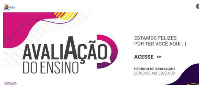
Figura 1: Novo design do Instrumento da Avaliação do Ensino.

Além das dimensões já existentes no Instrumento, e atendendo à solicitação da PROGRAD/COGRAD, o GT desenvolveu uma dimensão para avaliar as atividades do ensino remoto utilizado durante a pandemia. As questões sugeridas pelo GT e aprovadas pela PROGRAD estão descritas no quadro 1.