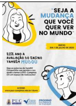
Figura 3: Cartaz da Campanha da Avaliação do Ensino para o 2º semestre de 2020.

AVANÇOS: a) A pandemia fez com que a Universidade, particularmente a PROGRAD, se adaptasse rapidamente e iniciasse as atividades acadêmicas no formato remoto. b) Implantação das Dimensões B e C do novo instrumento da Avaliação de Ensino, mesmo diante dos desafios da pandemia, incluindo a avaliação de uma dimensão extra sobre as atividades proposta pela Universidade para o Ensino Remoto. c) A participação dos estudantes nos dois ciclos avaliativos de 2020 foi acima de 10%, o que permite fazer a análise estatística de forma representativa para os estudos da equipe de gestão da Universidade.