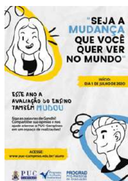
Figura 3: Cartaz da Campanha da Avaliação do Ensino para o 2º semestre de 2020.