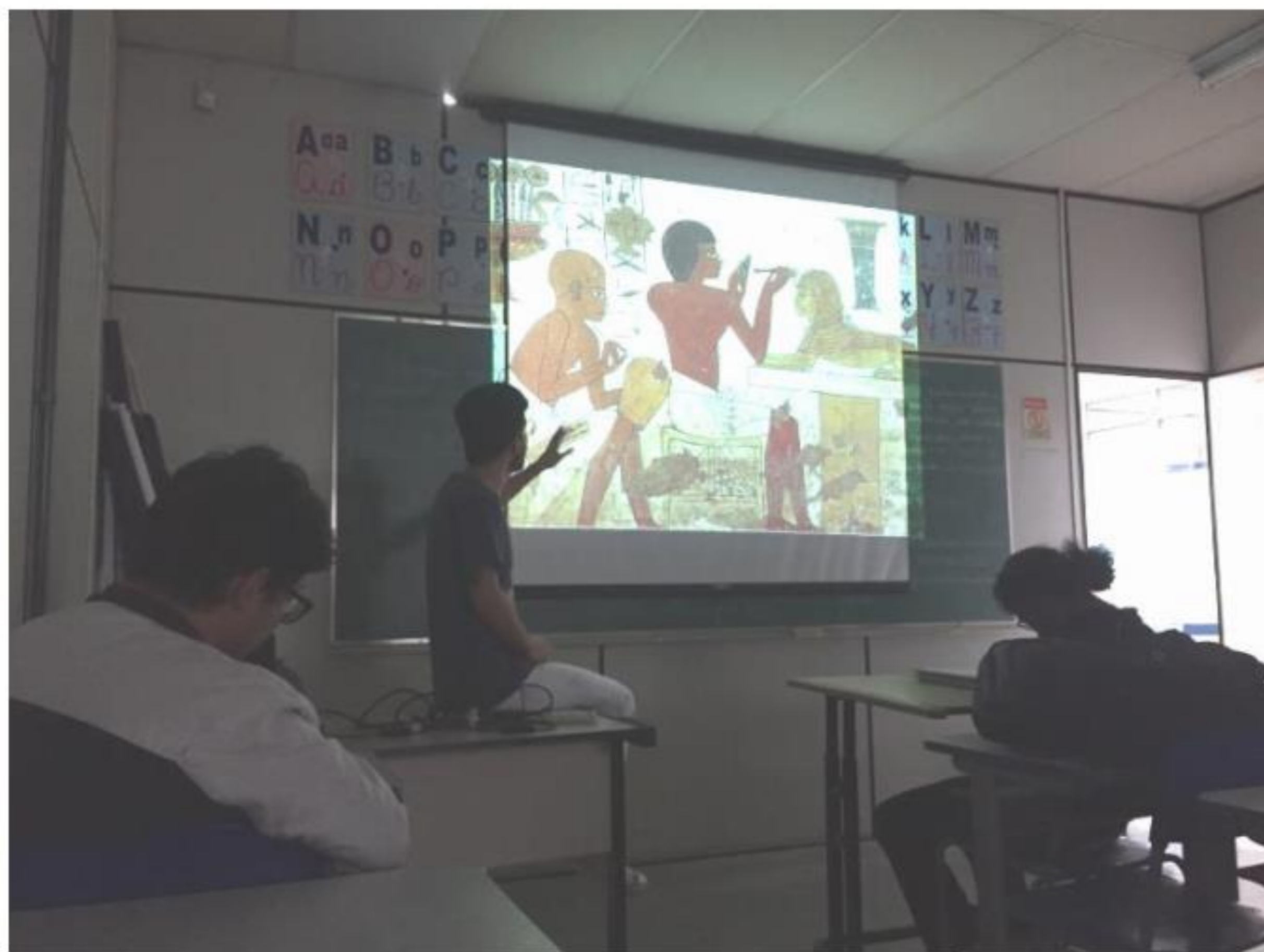
Aplicação das atividades propostas para alunos do EJA (CEMEFEJA Pierre Bonhomme).