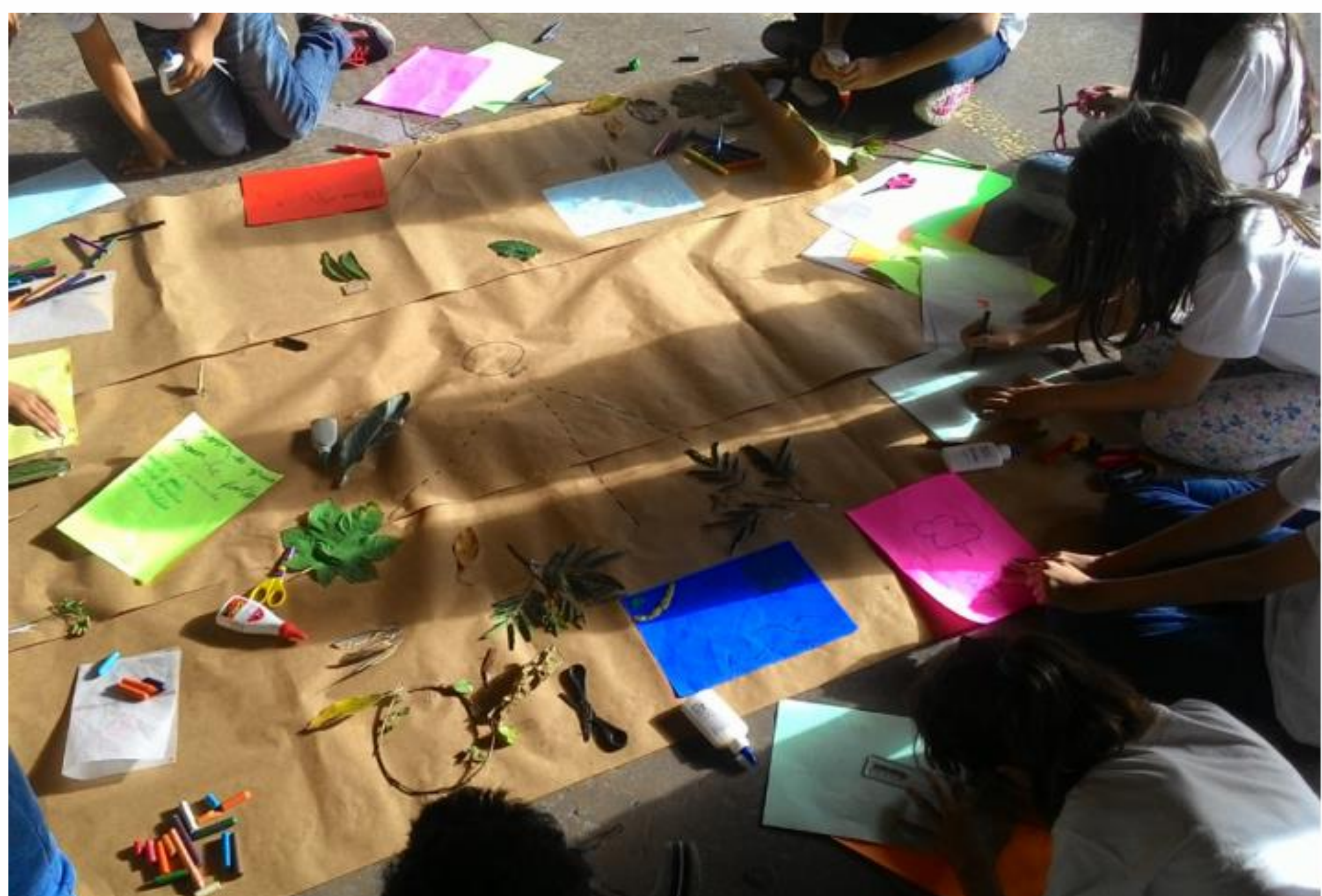
Aula Tour Sensorial realizada com alunos do Ensino Fundamental I: criação de mapa coletivo

Palavras-chave: arte-educação; arte contemporânea; processo criativo; ateliê; artistas visuais.