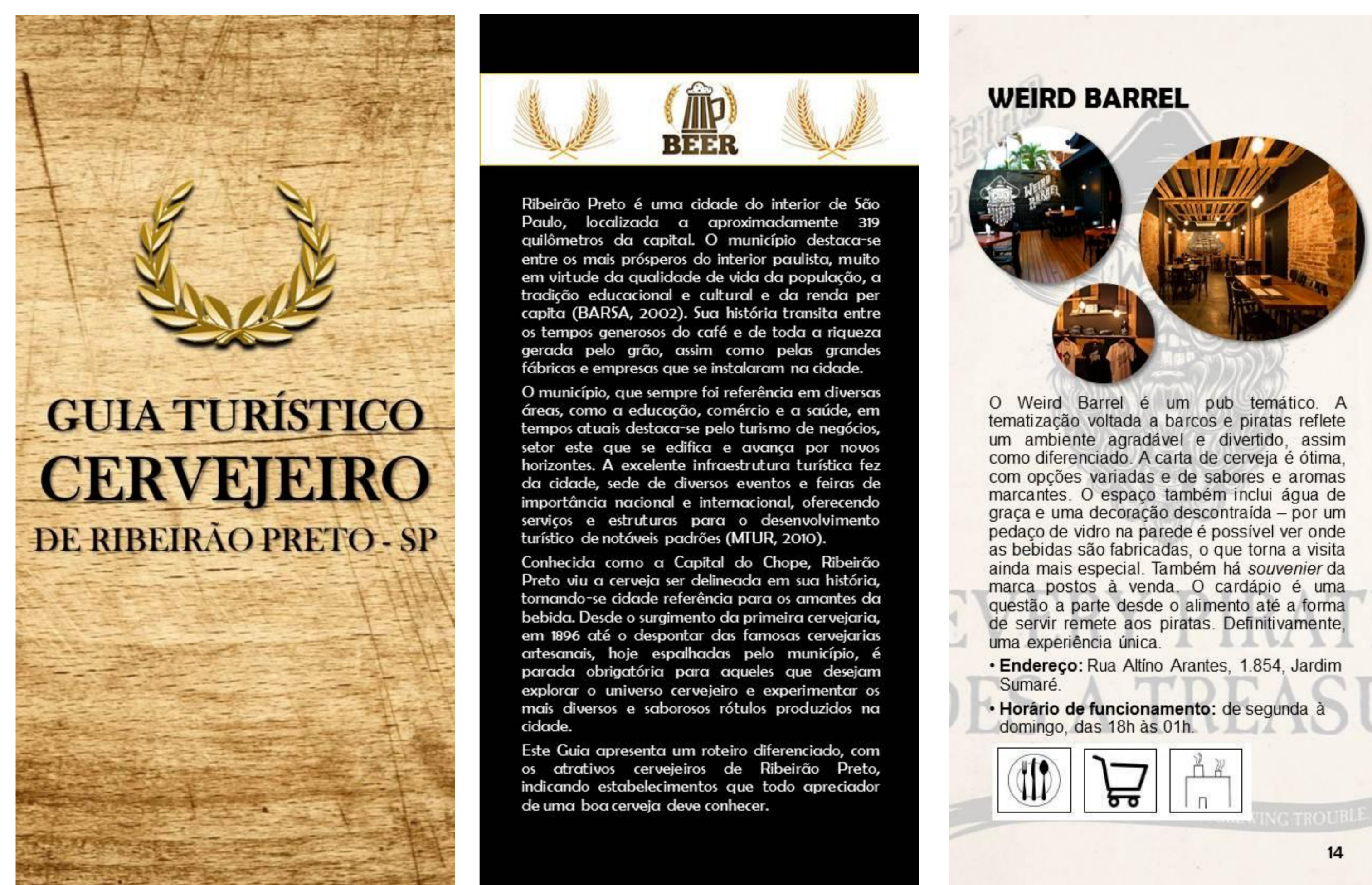
[1] – Capa do guia turístico cervejeiro; [2] – Apresentação; [3] – Bar Weird Barrel com descrição do local e iconografia.