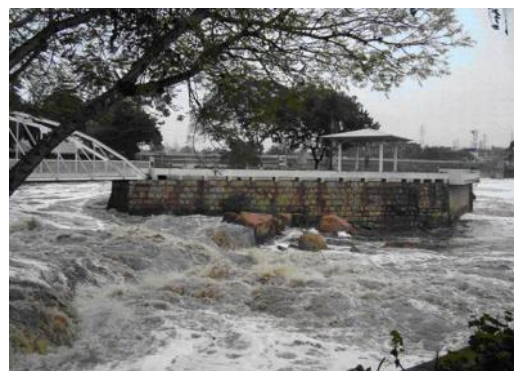
Figura 8: Foto de parte da praça no meio do rio Tietê

A segunda área , considerada de valor histórico, fica ao lado do mais extenso rio paulista, o rio Tietê, onde, além de ser local de partida de algumas excursões bandeiristas foi construída uma das primeiras hidrelétricas do estado de São Paulo, por ladear um grande salto d'água com grande potencial energético, que deu nome à cidade.