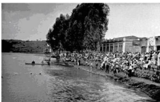
Figura 1: Competição de Natação em 1950 no Rio Jundiá (Museu da Cidade de Salto)

A partir da análise da história da cidade, da legislação vigente e das obras realizadas nesses oito anos foi possível discernir critérios e dividir o trabalho em três etapas relevantes, cada uma delas com um objeto de estudo específico e representativo, vinculado-as ao sistema de espaços livres públicos de algum setor da cidade.