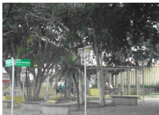
Figura 4: Área com mesas para jogo (Leticia Marton)

A primeira área foi considerada de valor social e vinculada à formação da cidadania por se caracterizar como ponto de encontro, devido a sua localização central, a presença de intenso comércio especialmente bares e sorveterias que incitam a vida – inclusive a noturna - propiciando o uso intenso e freqüente em quase todos os dias e horário.