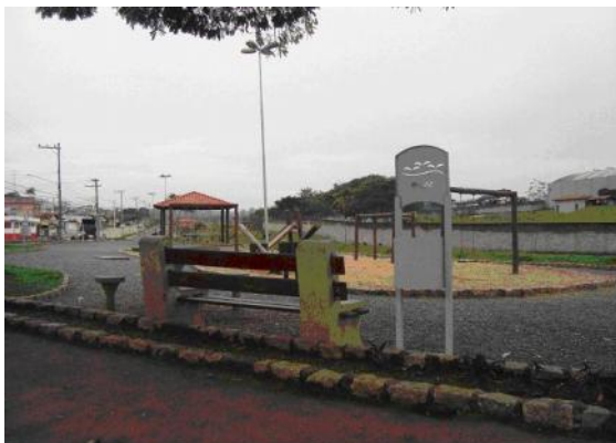
Figura 12: Área com equipamentos infantis (Leticia Marton)

uma vez que geralmente esses distritos ficam mais afastados da moradia.